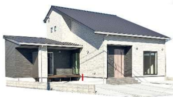
1号棟モデルハウス